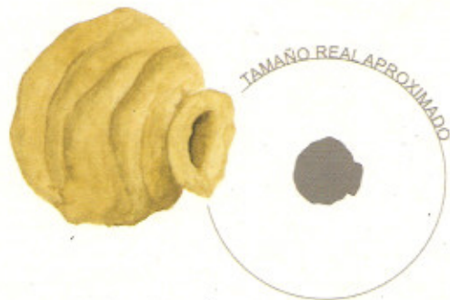
Uno de los nidos más curiosos en forma de vasija y que podemos encontrar adheridos en tallos, piedras, muros...

Las avispas alfareras realizan su nido con barro, de ahí su nombre. Construyen unas formaciones huecas, muy curiosas, adheridas a los tallos de las plantas o en muros y paredes. Una vez realizado el nido, ponen el huevo y lo llenan con larvas y gusanos no velludos. Les clava el aguijón y los paralizan, pero