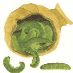
Interior de un nido vasija, lleno de pequeños gusanos.