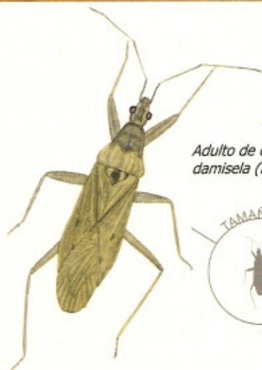
Adulto de chinche damisela (Nabidae)

y con 4 partes. Sus antenas son ligeramente más largas que en otras chinches. Las patas son largas y robustas, sobre todo las delanteras, para atrapar a sus presas.