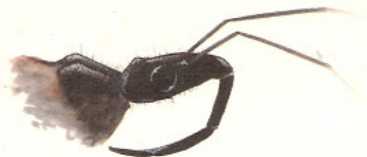
Detalle de la cabeza de una chinche asesina (Reduviidae) en la que se observa su afilado pico con el cual se alimenta.