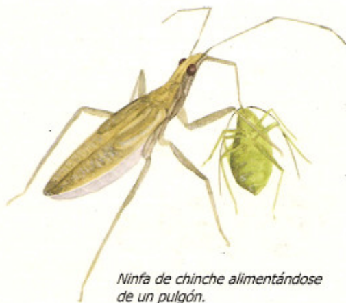
Ninfa de chinche alimentándose de un pulgón.

Están vinculadas a cubiertas vegetales, lindes con vegetación natural y flora arvense. Es fácil confundir estas chinches con otras más abundantes como las rojas y negras que se concentran en invierno entre las grietas de los troncos o bajo piedras. La observación es fundamental no sólo de su aspecto sino también de su comportamiento. A veces resulta interesante e incluso gratificante destinar algunos minutos a observar los insectos que se encuentran en nuestros cultivos y alrededores. Una lupa facilita mucho las cosas. Cuidado al manipularlas porque pueden picar.