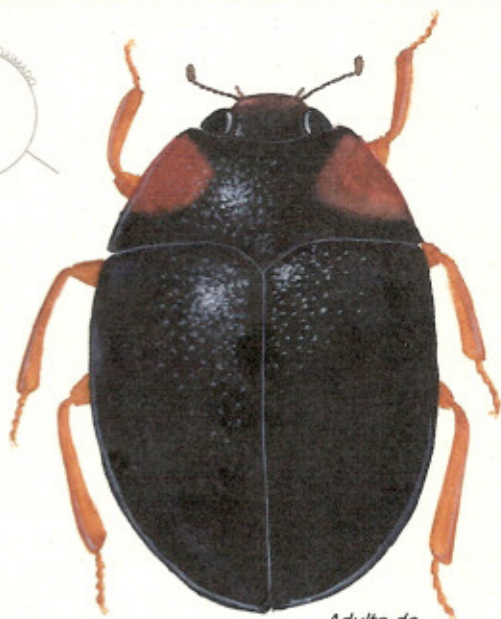
Adulto de mariquita negra