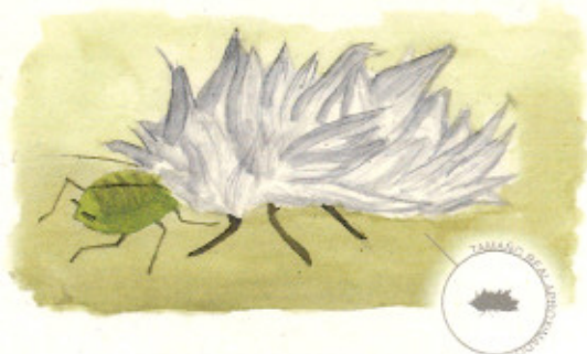
Larva alimentándose con su característica cubierta algodonosa

su vida consumen gran número de estos. Pueden volar y al cabo del año se pueden dar de 2 a 3 generaciones según las condiciones climatológicas.